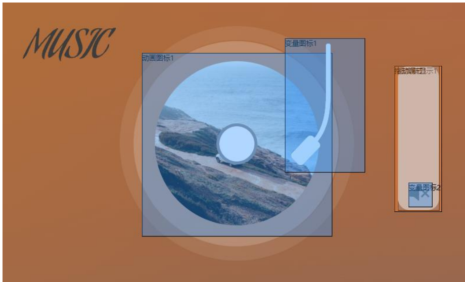
图 1. 音量调节页面

如图 1 所示,在工作区的背景图片上中间位置有一个动画图标控件和一个变量图标控件只是用来表示音频正在播放的动画,因为在这个案例中这两个控件不涉及 Lua 脚本,控件的使用方法参考 VGUS 用户开发指南,这里就不再赘述。右侧有一个进度条控件和拖动调节控件相互配合以实现拖动调节音量的显示效果。在滑动条上还放置了一个变量图标用于显示音量图标,当音量为 0 时,音量图标会变为静音图标。