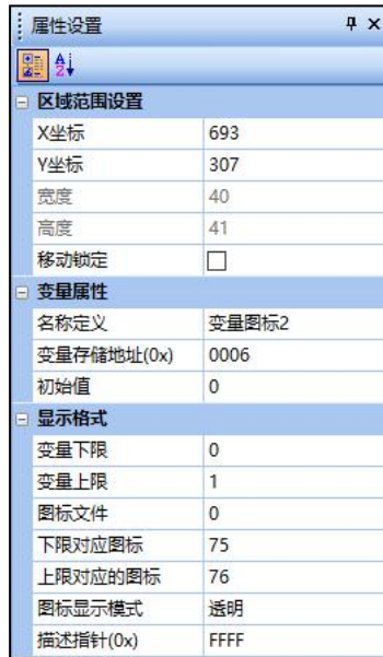
图 4 “音量状态”变量图标控件属性

如代码所示，首先通过 vgus_vp_var_read(vp_addr, var_type) 函数，读取拖动调节控件对应的变量地址 0x0005 中的数值赋值给“vol”变量，然后通过 vgus_reg_write(reg_addr, write_len, write_table) 函数，往 0x53 寄存器里写入 0x5A ，表示申请写入音量值，往 0x54 寄存器写入读取到的音量值“vol”。除此之外还需要根据当前音量值来显示音量状态图标。音量状态对应的变量图标控件属性如图 4 所示。